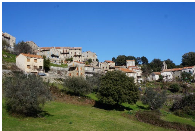
Zigliara en harmonie avec un écrin naturel et agricole de qualité

La convivialité du village est maintenue grâce aux lieux de rencontres que sont les différents espaces publics : rue, placette, églises... le patrimoine au sens large valorise le cadre de vie, le rendant beau. Cette beauté partagée alimente aussi le sentiment d'appartenance et donc de communauté. Le PLU s'attachera à conserver cette valeur par des choix adaptés qui poursuivront les efforts des ancêtres qui ont su rester en équilibre et dans le respect du paysage du Taravo.